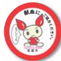
「献血PRバッジ・イメージ」

1月10日の成人式で配布する献血PRバッジ(※)を付けて、1月17日(日)の献血に協力いただくと、特別な記念品を差しあげます。