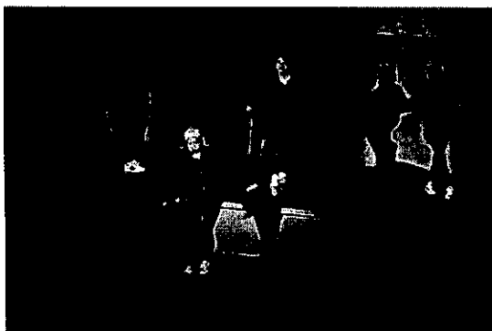
△「ESP DANCE PES2019」 小学生から高校生までのダンスチーム(11 団体)が参加し、パフォーマンスを競い合います