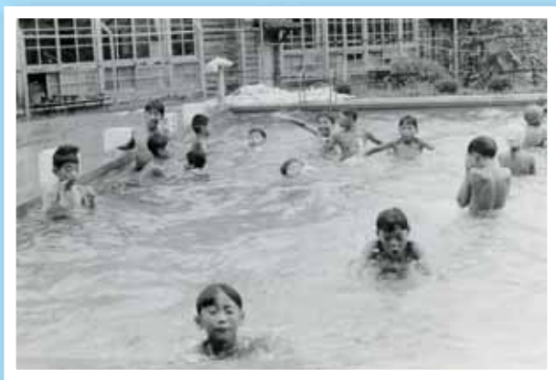
1967年撮影 第一小学校プールの様子