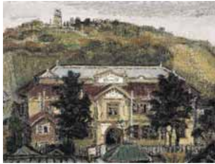
≪塩釜市役所旧庁舎≫