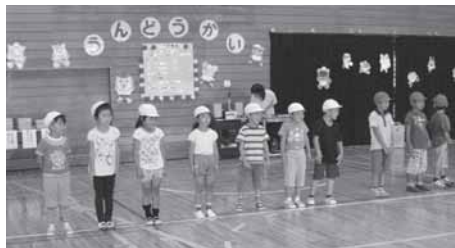
公立保育所による合同運動会