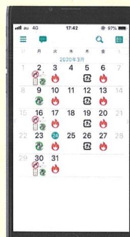
ごみ収集日カレンダー