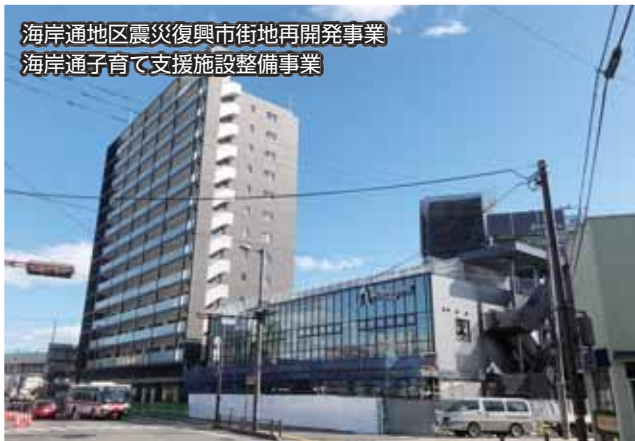
海岸通地区震災復興市街地再開発事業 海岸通子育て支援施設整備事業

▲昨年度は一番地区のマンション棟と事務所棟、駐車場棟の建設が進み、二番地区の工事も着工しました。