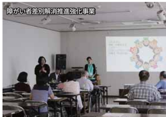
障がい者差別解消推進強化事業