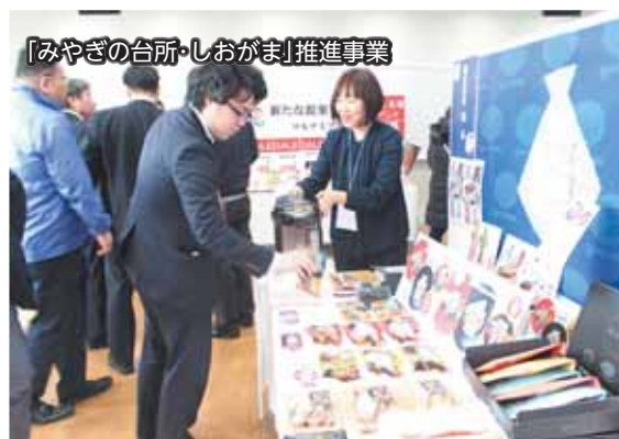
「みやぎの台所・しおがま」推進事業