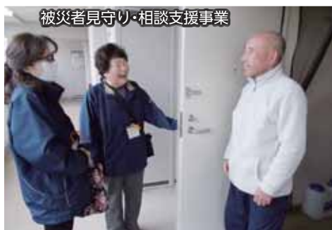
被災者見守り・相談支援事業

▲昨年度は一番地区のマンション棟と事務所棟、駐車場棟の建設が進み、二番地区の工事も着工しました。