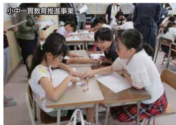
小中一貫教育推進事業