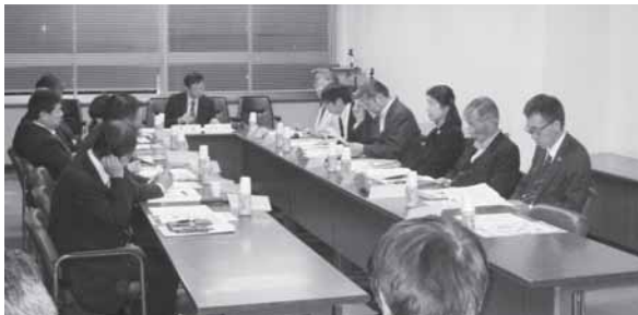
▲市内団体の代表者などで構成する懇談会で意見交換を行いながら、策定を進めていきました

国の「まち・ひと・しごと創生法」に基づき、本市の人口減少の克服や地域経済の発展を図り、魅力あふれる地域づくりを推進するために「塩竈市まち・ひと・しごと創生総合戦略」を策定しました。内容は人口の動向分析や人口減少に係る影響の想定ならびに地域特性および地域課題、基本目標と施策の方向性を示したものです。