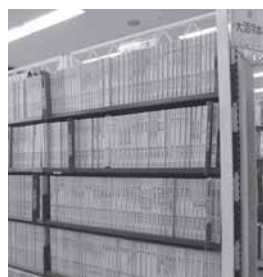
▲大活字本コーナー 人気作家の本も多数あります

A 最近、そうおっしゃる方が増えてきました。図書館では、一般的な本より活字が大きい大活字本もたくさん用意しています。またライトが点いて文字が拡大される拡大読書器や、1行ずつ拡大されて読みやすいリーディングトラックなどもあります。