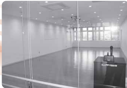
2階 中会議室 面積:85.28㎡ 収容人数:51人