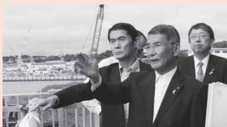
先月完成した魚市場中央棟の魚食普及スタジオや荷さばぎ所を視察しました。