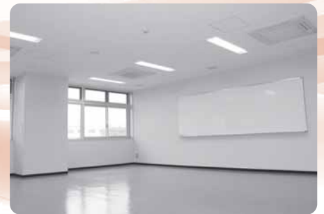
1階 小会議室 面積:58.95㎡ 収容人数:27人