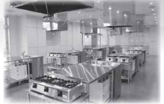
2階 魚食普及スタジオ 面積:107.64㎡ 調理台:7台

また、現在工事中の南棟の完成に合わせ、来年秋に地魚直売所や食堂がオープンする予定です。