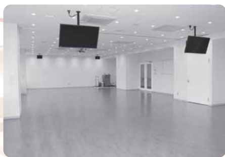
2階 大会議室 面積:166.21㎡ 収容人数:72人