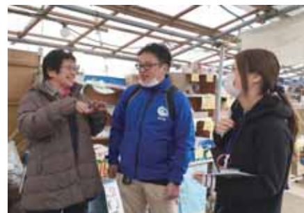
▲(左)浦戸野々島地区 生活支援コーディネーターと地域の皆さん。「ご近所さん同士でお互いに見守ったり、見守られたりして安心するね」と身近な支え合いを改めて感じていました。 (右)生活支援コーディネーターが、地域の取材をしながら、人と人をつなげていきます。