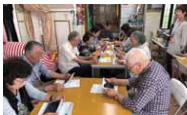
▲(上)健康講話 (下)認知症予防講座