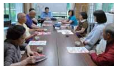
▲警察署から講師を招き、消費者被害防止の講話を実施

られる」「近所に住む高齢者が家族から虐待を受けているかも」などの高齢者虐待(疑いを含む)の相談