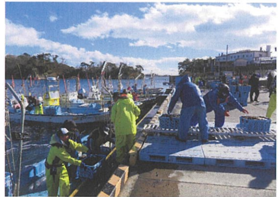
昨年12月20日の初水揚げの様子 水上漁港にて(塩釜市新浜町三丁目)