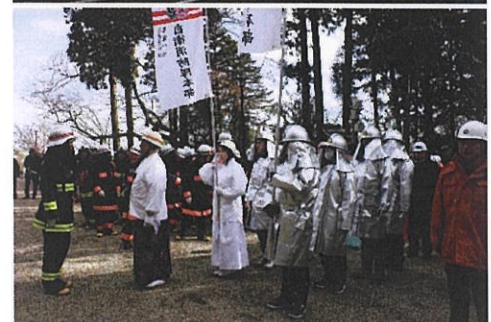
昨年の文化財防火デーの様子