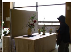
生け花の展示コーナー

10月5、6日、市民交流センターで恒例「塩釜市芸術文化祭」が開催されました。35回目を記念して古代笛と日本舞踊のコラボレーションで華やかに開幕。様々なステージ発表や展示など、館内は多くの皆さんで終日にぎわいました。（10月5日 市民交流センター）