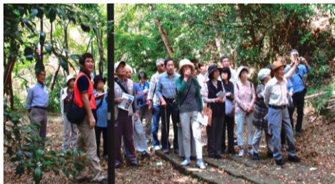
「楽しみにしていました」勝画楼の見学会に集う市民の皆さん。右は紅葉が始まった勝画楼の外観