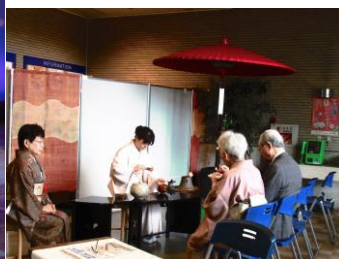
エントランスに設けられたお茶席