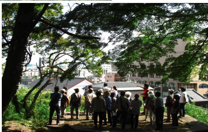
「勝画楼」脇の灯台跡から、当時海を臨んだ風景に思いをはせる皆さん