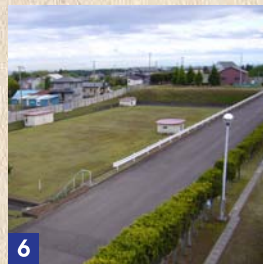
6 配水池 [はいすいち] きれいになった水が溜められ、住宅や工場に送られます。