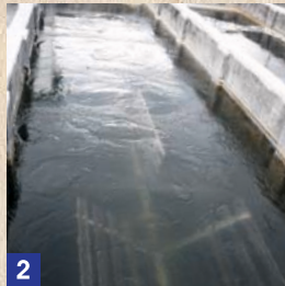
2 凝集池 [ぎようしゅうち] 原水に含まれる小さなにごりの成分を、薬品により大きな塊にします。