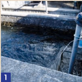
1 着水井 [ちやくすいせい] ダムから来た水(原水)は、最初にここに届きます。