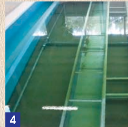
4 急速ろ過池 [きゅうそくろかち] 砂と砂利の層に通してさらにきれいにします。