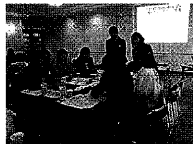
平成 30 年度開催「いきいき キャリアアップ研修 in 塩竈」 グループトークの様子