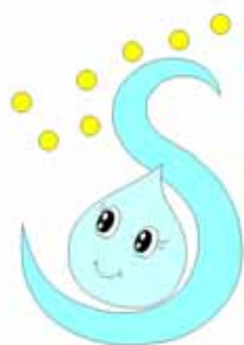
塩竈市水道部イメージキャラクター 【シオンちゃん】